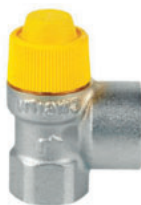
Βαλβίδα ασφαλείας για ηλιακά