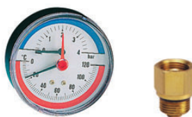
Θερμοδρόμετρο πίσω σπειρώμα