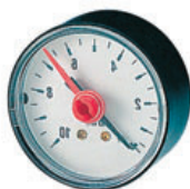
Μανόμετρο πίσω σπειρώμα