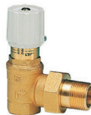
Βαλβίδα διαφορικής πίεσης