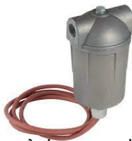
Φίλτρο πετρελαίου με αντίσταση