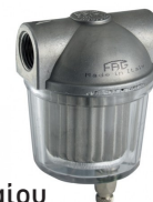
Φίλτρο πετρελαίου με νεροπαγίδα