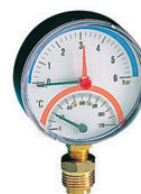
Θερμοδρόμετρο κάτω σπειρώμα