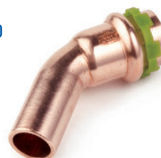
Καμπύλη 45° αρσενική-θηλυκή