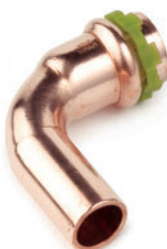
Καμπύλη 90° αρσενική-θηλυκή