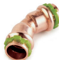
Καμπύλη 45° θηλυκή