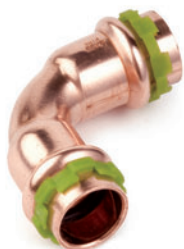
Καμπύλη 90° θηλυκή