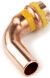
Καμπύλη 90° αρσενική-θηλυκή