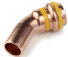
Καμπύλη 45° αρσενική-θηλυκή