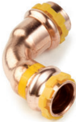
Καμπύλη 90° θηλυκή