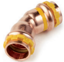
Καμπύλη 45° θηλυκή